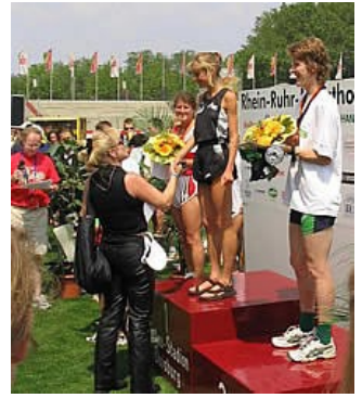
Duisburg DM Marathon 3. Gesamt