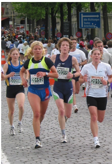
Bern Altstadt GP 5 km